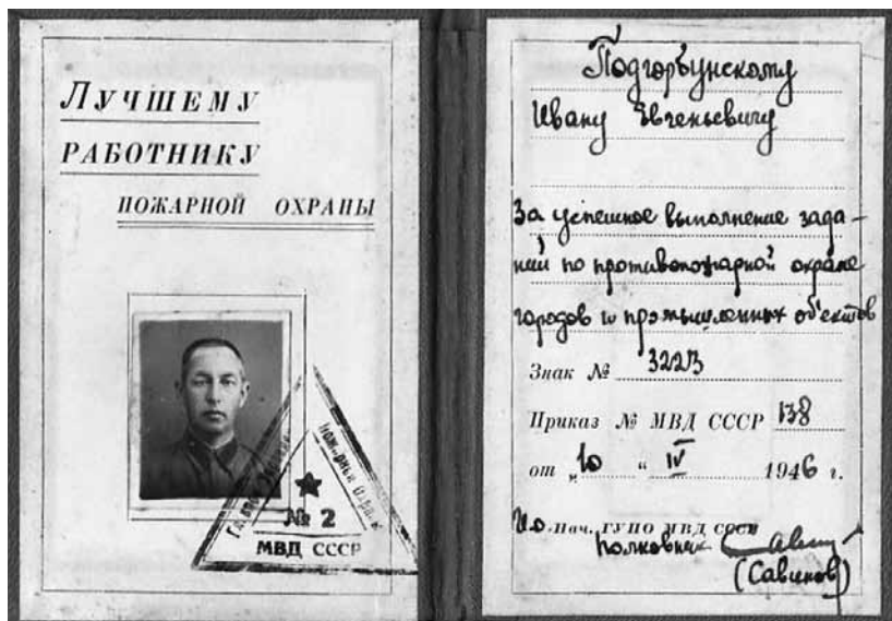
Удостоверение к нагрудному знаку МВД СССР «Лучшему работнику пожарной охраны», 1946 г.