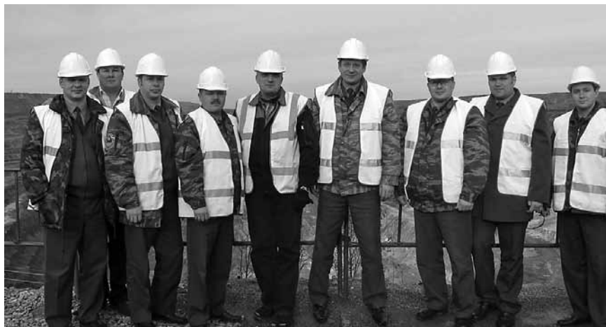
Управление ГПН на проверке Костомукшского ГОКа

В 2004 году органы ГПН выделили из отрядов в отдельное управление в Главном управлении МЧС России по Республике Карелия. Начался сложный момент распределения кадров. Все прекрасно понимали, что теперь в пожарной охране районов суще-