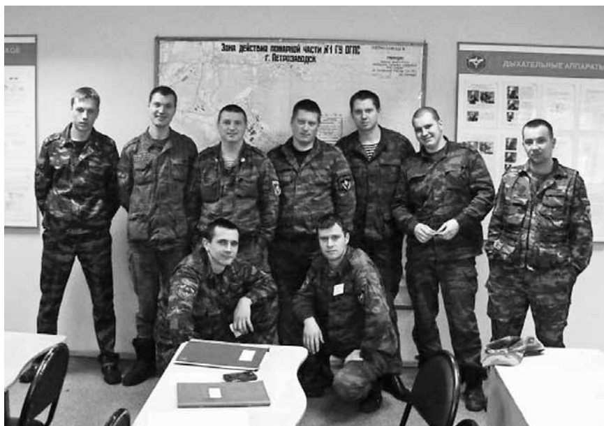
Каравл ПЧ-1 по охране г. Петрозаводска

Работая в ОАО «Славмо», через несколько лет получил водительский стаж и в 2005 году поступил на службу в пожарную охрану. 11 лет работал водителем пожарного автомобиля, участвовал в тушении многих крупных, серьезных пожаров.