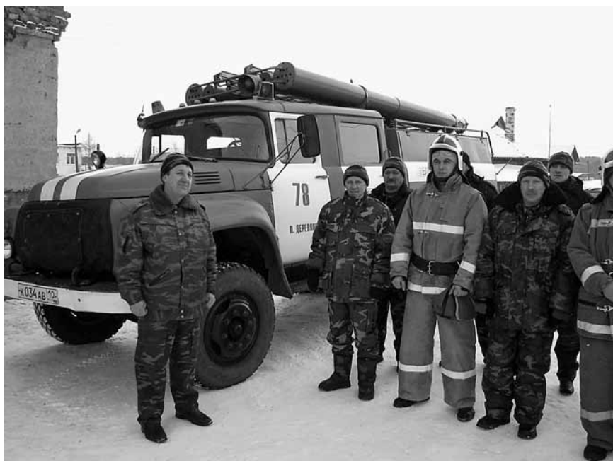
Торжественное открытие нового здания пожарной части № 78 пос. Деревянное «ОПС по Прионежскому району», 22 декабря 2009 г.