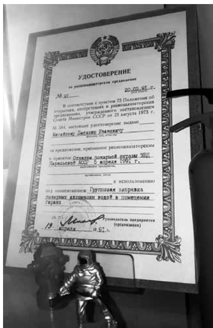
Удостоверение № 91 на рационализаторское предложение

В нашем семейном архиве до сих пор хранится Удостоверение № 91 на рационализаторское предложение «по групповой заправке пожарных автомашин водой в помещении гаража», выданное ему в 1991 году.