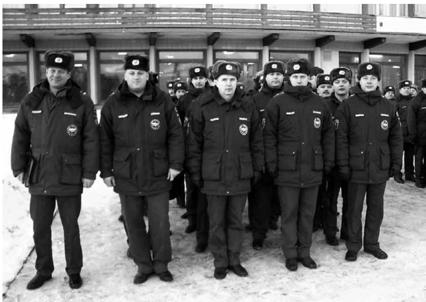
УГПН на строевом смотре

здание гостиницы, а затем ещё и деревянное с печным отоплением здание городской пожарной части.