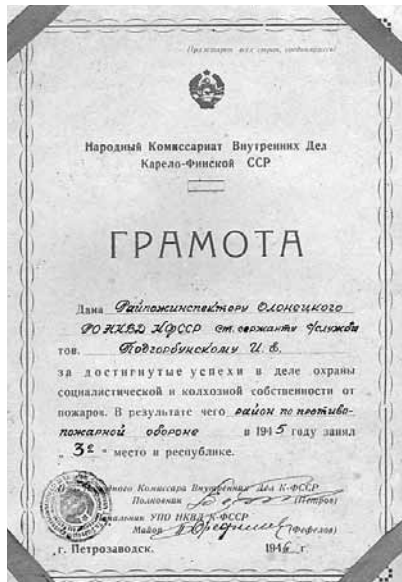
Грамота НКВД Карело-Финской ССР, 1945 г.