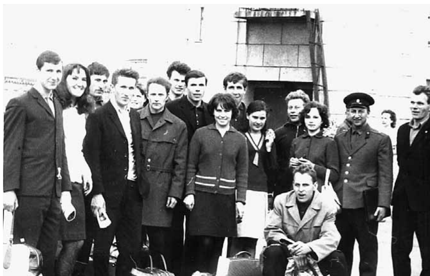
Сборная Карелии перед выездом в Калининград