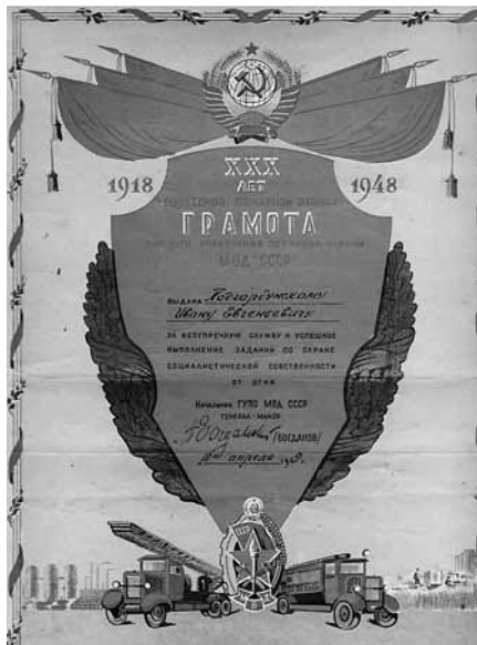
Грамота ГУПО МВД СССР, 1949 г.