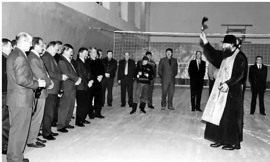
Открытие здания Сортавальской пожарной части, церемония освящения, 80-е гг.

дении совместных спасательно-тактических учений, как первый шаг в нашем сотрудничестве, претворилась в жизнь. Проведение этих учений можно считать историческим и основополагающим событием, так как между нашими странами еще нет соглашения о таком сотрудничестве. От совместной работы мы получили полезный опыт, много практических знаний и умений, и вместе с тем мы имели возможность познакомиться друг с другом».