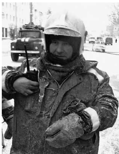
Руководитель тушения пожара на улице Ленина, 10, январь 2006 г.