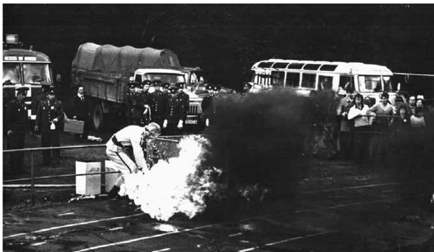
На соревнованиях по ППС