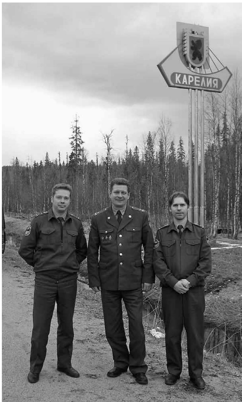
В Лоухском районе