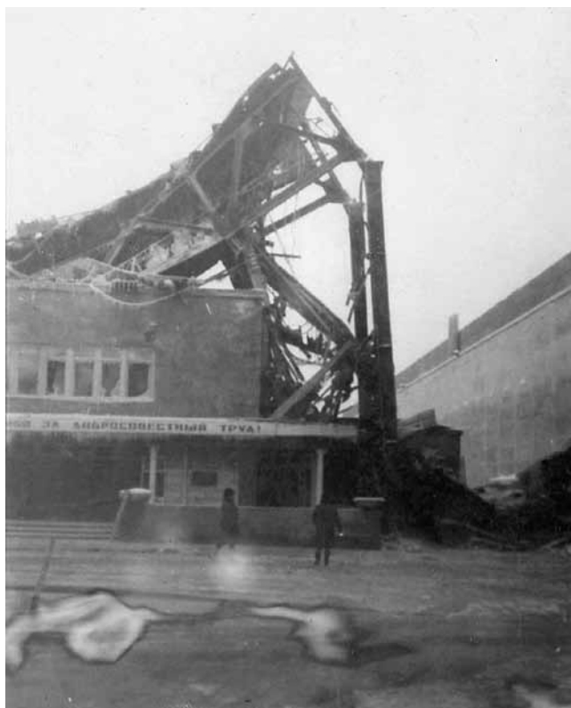
Обрушение галереи на Кондопож- ском ЦБК