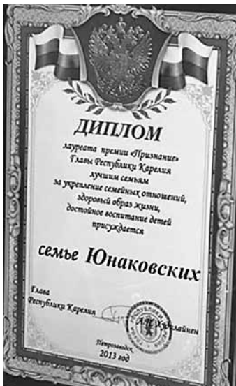
Диплом лауреата премии «Признание», 2013 г.