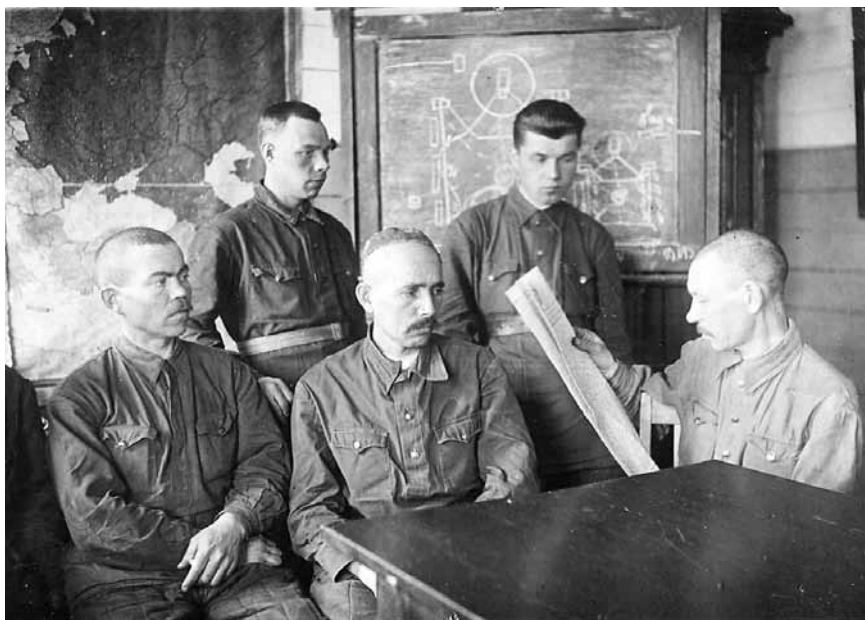
Бойцы СВПК г. Архангельска за чткой газеты, 1942 г. 1