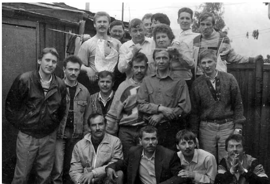
Самый дружный караул СВПЧ-1, 90-е гг.